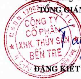
ĐẶNG KIẾT TƯỜNG